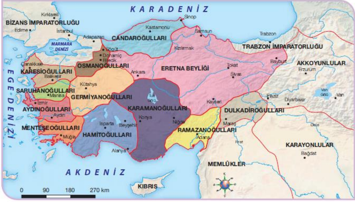
Harita 1.5: XIV. Yüzyıl Başlarında Anadolu'da Kurulan Türk Beylikleri (İkinci Beylikler Dönemi)

Kösedağ Savaşı'ndan sonra Anadolu'da kurulan Türk Beylikleri ve kuruldukları bölgeler şunlardır: