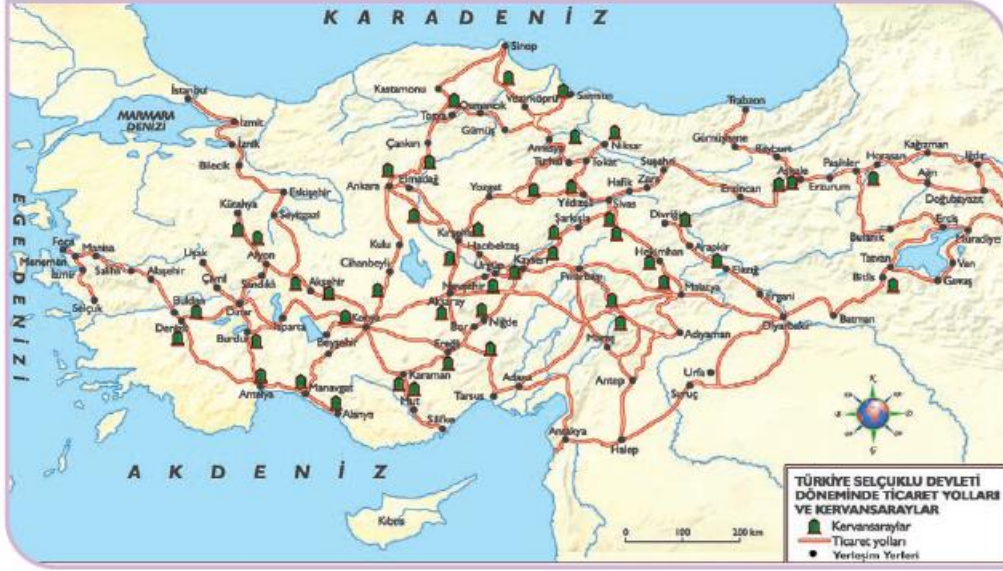
Harita 1.2: Türkiye Selçukluların Dönemi'nde Anadolu'daki başlıca ticaret yolları

Türkiye Selçukluları Sinop, Samsun, Alanya, Antalya gibi önemli liman şehirlerine sahip olunca deniz ticaretine büyük önem verdiler. Müslüman ve yabancı tüccarların emniyet içerisinde seyahat etmeleri ve ticaretlerini rahat yapabilmeleri için çeşitli önlemler aldılar. Tüccarlara her türlü gümrük kolaylığı sağladılar. Ticaret yollarının güzergâhları üzerine kervansaraylar inşa ettiler. Kervansaraylara gelen misafirlerin ihtiyaçlarını ücretsiz karşıladılar. Ayrıca kervanları zarar gören tüccarların zararlarını karşılamaya yönelik bir çeşit sigortacılık sistemi geliştirdiler. Yine şehir merkezlerinde çarşı ve pazarlara yakın yerlere han veya kapalı çarşılar kurarak esnaf ve tüccarlara kolaylık sağladılar.